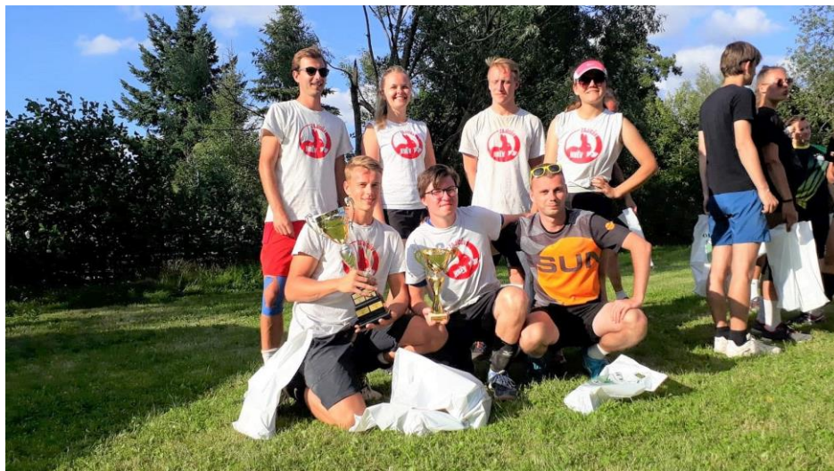
Vítězné družstvo volejbalového turnaje.