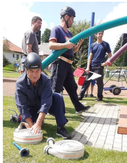
Příprava na požární útok.

ROČNÍK XV. – VYDÁNO: 27. 8. 2021 - MĚSÍČNÍK - ČÍSLO: 9. Uzávěrka příštího čísla 24. 9. 2021.