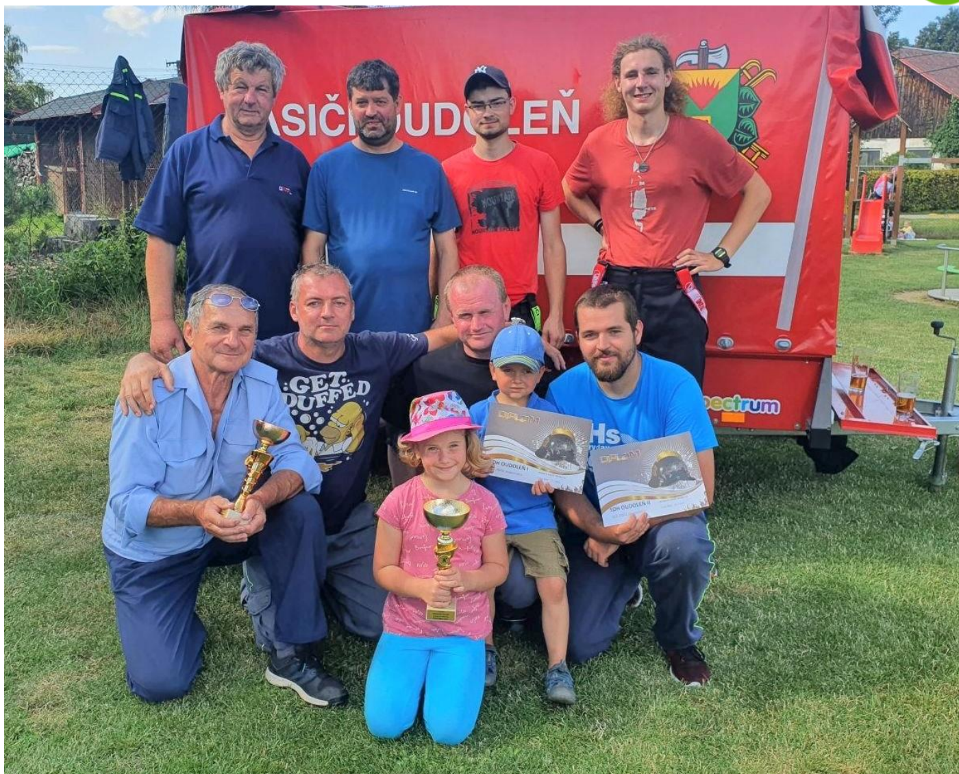
Naši hasiči se na okrskové soutěži umístili na 1. a 3. místě.