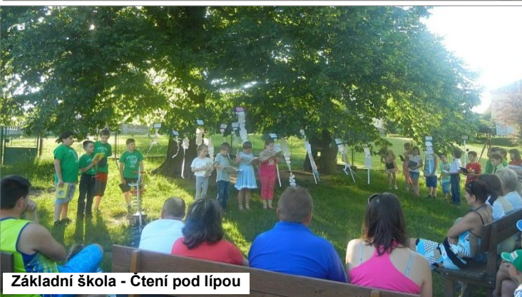
Základní škola - Čtení pod lípou