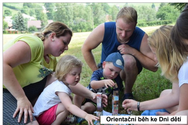
Orientační běh ke Dni dětí