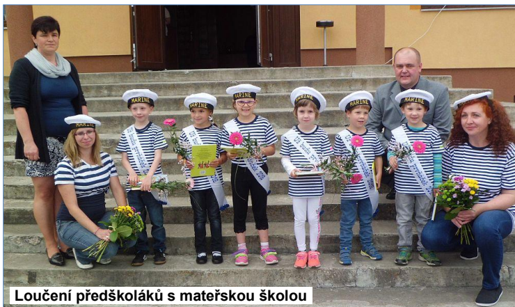
Loučení předškoláků s mateřskou školou