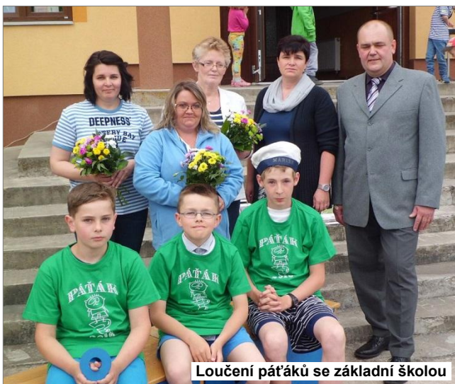
Loučení pátáků se základní školou