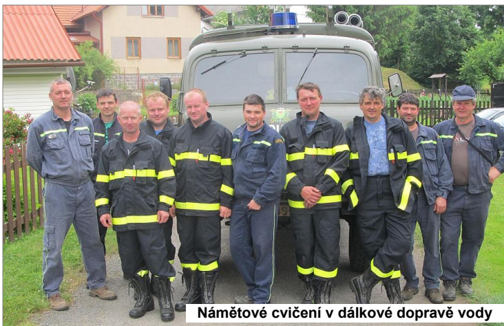
Námětové cvičení v dálkové dopravě vody